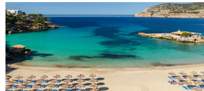
Bucht von Camp de Mar